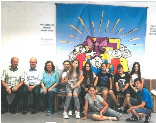
Teilnehmerinnen und Teilnehmer der RKW in Roßbach

In den letzten Jahrzeiten wurden in gemeinsamer Zusammenarbeit zahlreiche Sozial-, Bildungs- und Jugendprojekte in beiden Ländern umgesetzt. Hierzu kann man die erfolgreichen katholischen Kinderbibelwochen in Roßbach erwähnen.