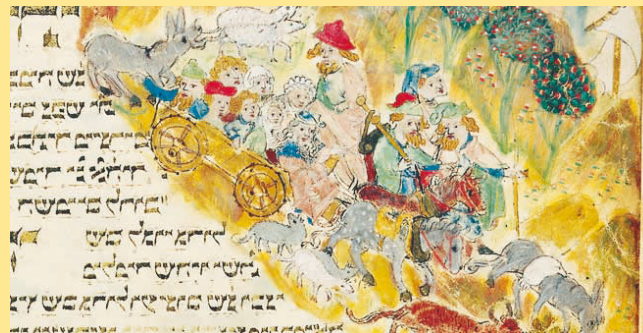
Flucht aus einer deutschen Stadt. Aus einem Gebetbuch von 1427.