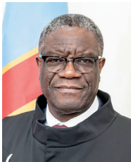
Dr. Denis Mukwege, Panzi-Hospital Bukavu: Traumatisierte Opfer und straffreie Täter – der Skandal im Ostkongo