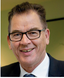
Internationale Konferenz unter der Schirmherrschaft von Bundesminister Gerd Müller