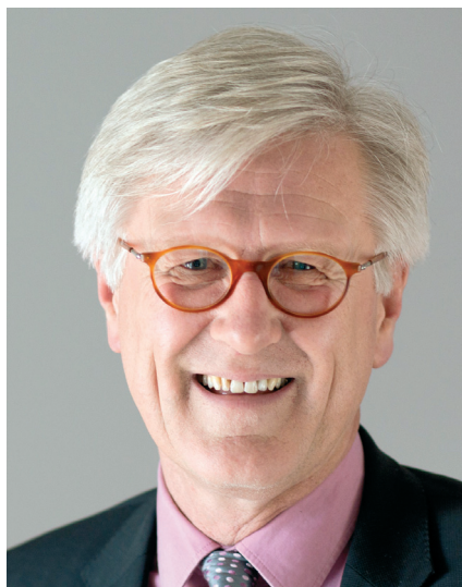
Reinhard Kardinal Marx Vorsitzender der Deutschen Bischofskonferenz