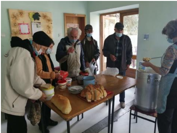
Suppenküche im Ort Senta, Serbien

Seit Jahren arbeitet die Partnerschaftsaktion Ost mit dem Caritas Subotica zusammen. Wir finanzieren eine Suppenküche in der Ortschaft Senta mit. Dadurch können sozial schwache, insbesondere ältere, Menschen eine warme Mahlzeit am Tag erhalten.